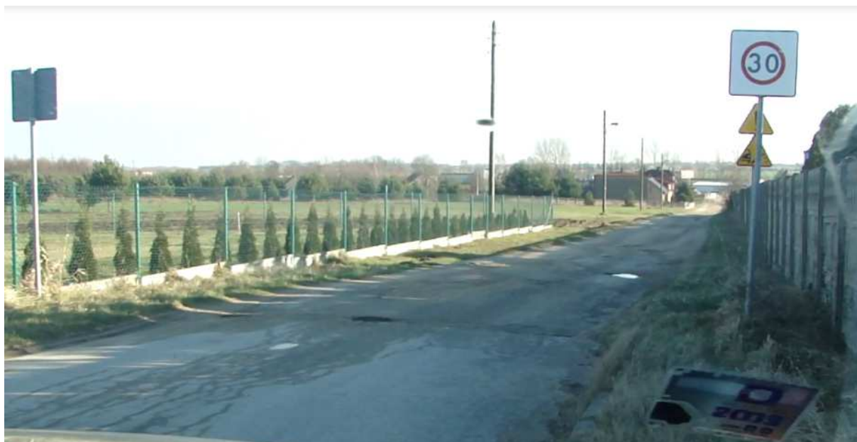
Widok ul. Łąkowej od strony ul. Orzeszkowej