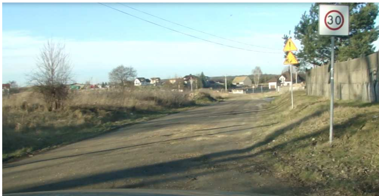
Widok ul. Łąkowej od strony ul. 11 listopada (DW492)

Orientacyjną lokalizację inwestycji przedstawiono na planie orientacyjnym w części graficznej opracowania.